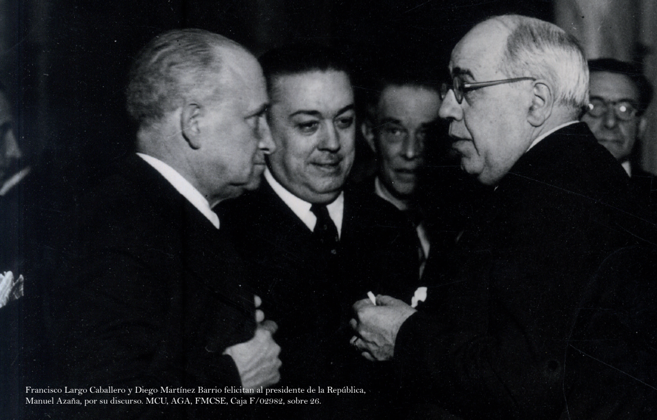
Francisco Largo Caballero y Diego Martínez Barrio felicitan al presidente de la República, Manuel Azaña, por su discurso.