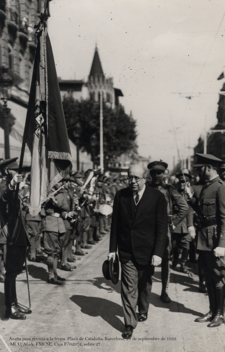
Azaña pasa revista a la tropa. Plaza de Cataluña. Barcelona. 28 de septiembre de 1932.

Manuel Azaña fue nombrado ministro de la Guerra en el primer Gobierno formado tras la proclamación de la Segunda República Española, el 14 de abril de 1931. Llegaba a esta cartera ministerial con el prestigio de haber dedicado una buena parte de sus reflexiones intelectuales al Ejército y su incardinación en un Estado democrático. Había publicado Estudios de Política Francesa Contemporánea. La Política Militar (1919) y conocía, a través de la experiencia del país vecino, cuáles eran las condiciones que debía cumplir el ejército de un país para convertirse en un instrumento al servicio de un Estado democrático.