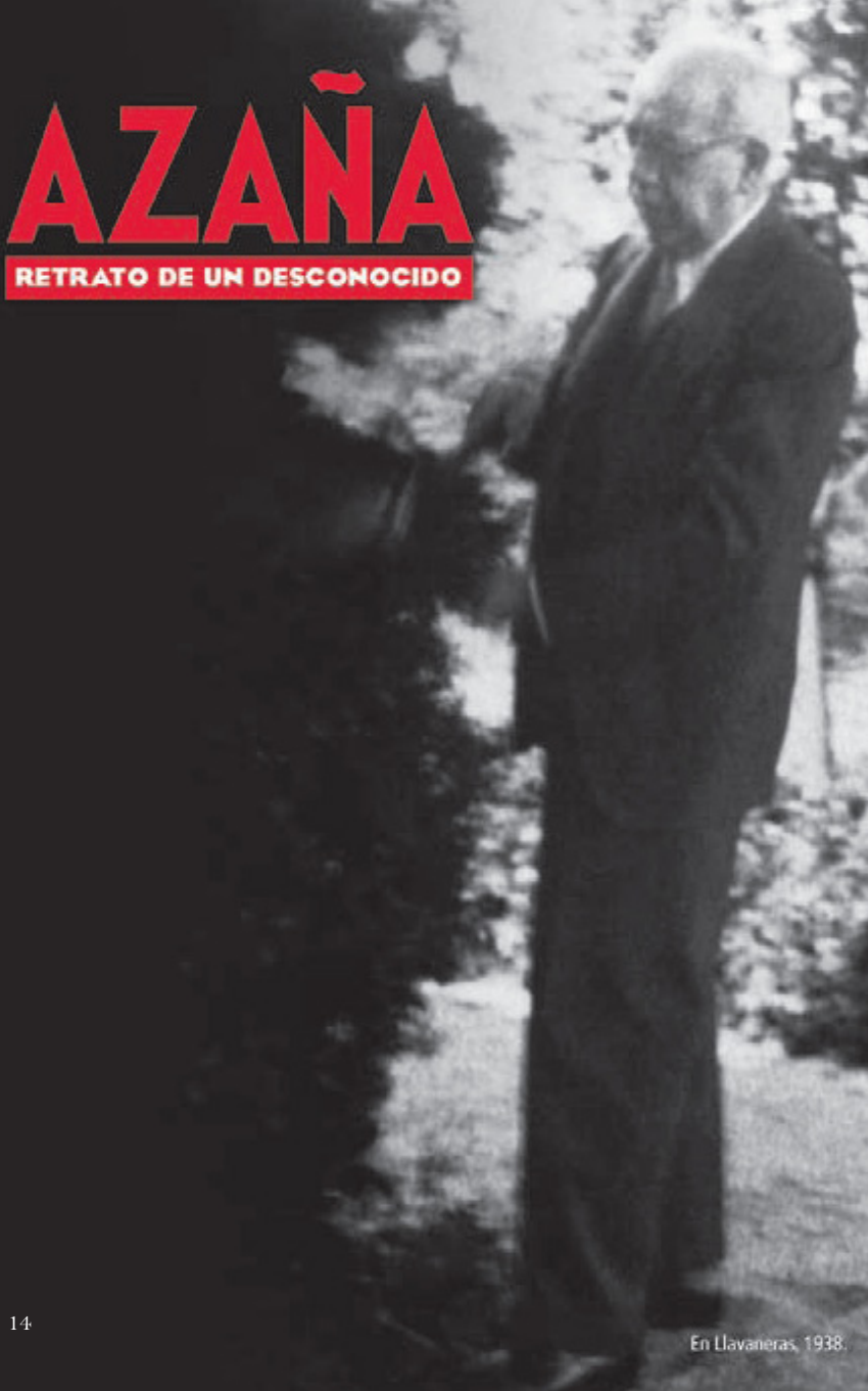
En Llanerías, 1938.