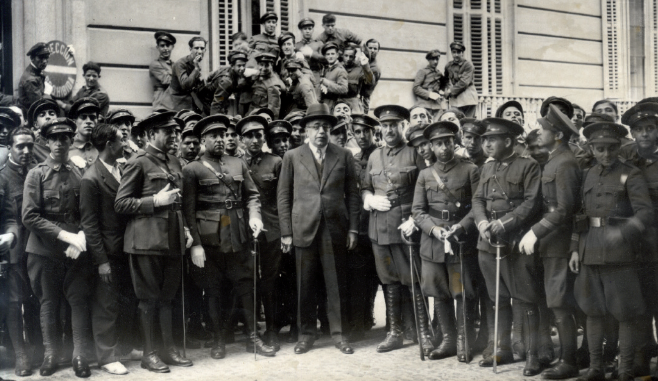
▲ El jefe del Gobierno y ministro de la Guerra, Manuel Azaña, rodeado de las clases y soldados que asistieron al acto de inauguración del Hogar del Soldado en la sede del Ministerio de la Guerra.