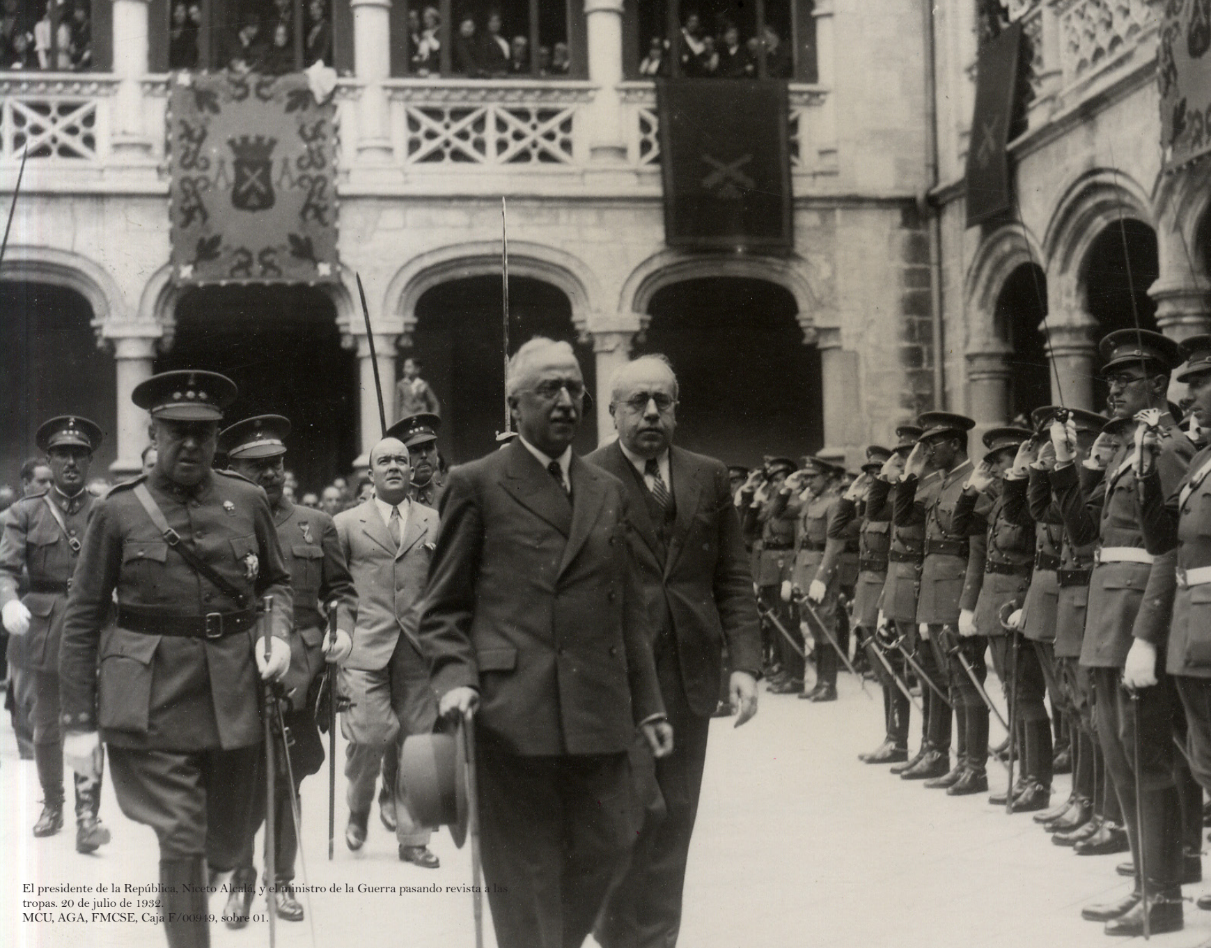
El presidente de la República, Niceto Alcalá, y el ministro de la Guerra pasando revista a las tropas. 20 de julio de 1932. MCU, AGA, FMCSE, Caja F/00949, sobre 01.