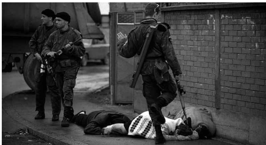
Los paramilitares de Arkan en Bijeljina (Bosnia-Herzegovina), marzo de 1992.